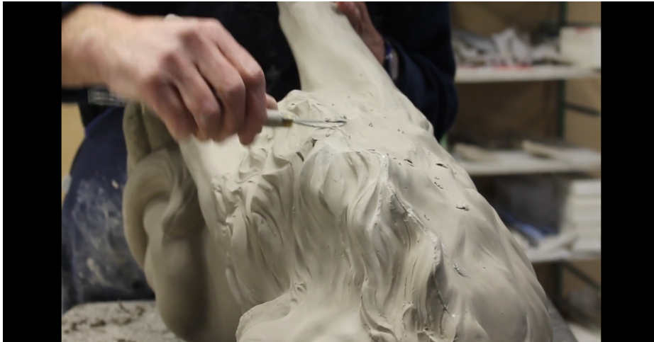
Stap 2: Vervolgens worden alle details op het dier aangebracht met een speciaal mesje