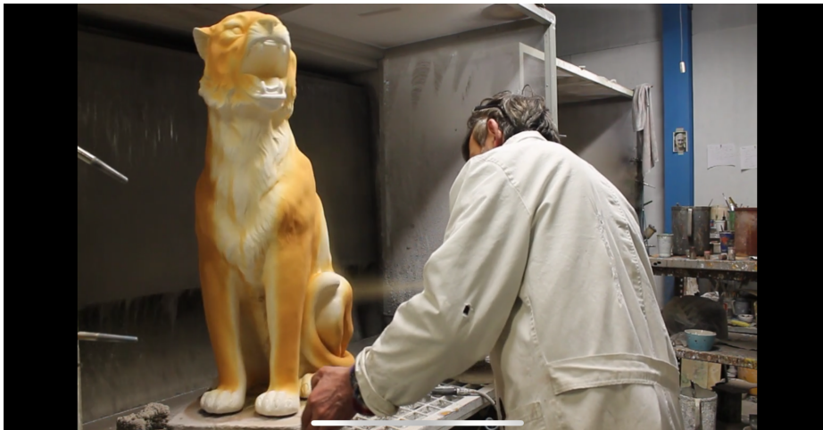
Stap 3: In stap 3 wordt de basiskleur met glazuur via een paintbrush op het beeld gespoten.