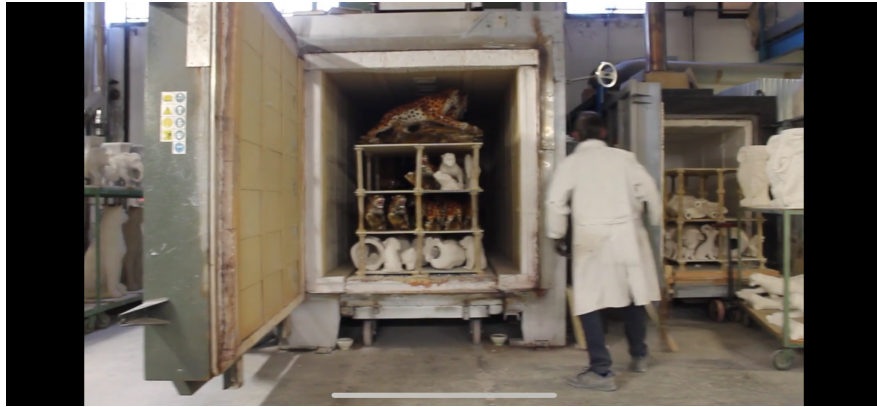
Stap 5: Alle beelden worden geglazuurd in de keramiek oven. Dit soort voor een stevige gladde laag.