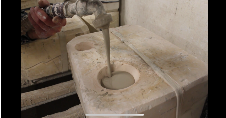
Stap 1: Eerst wordt de mal volgegoten met gietlei.